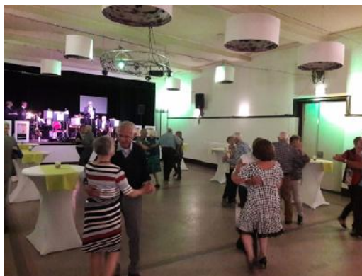
Foto-impressie van de dansavond in het Parochiehuis