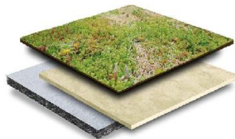
Voorbeeld van een groendak, de opbouw en de aanleg.