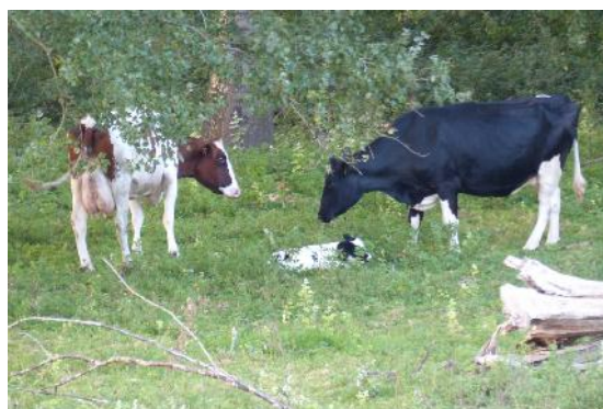
Kalfje in de Balijrand