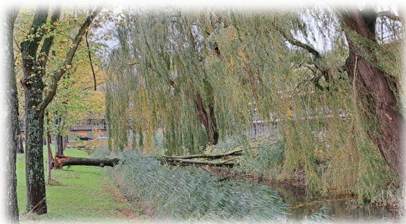
Najaar in Noord