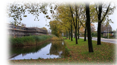
Voorbeeld bij een faunawandeling